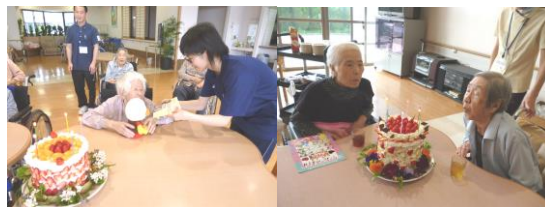
5月誕生会◎ 3月誕生会◎ Happy birthday to you