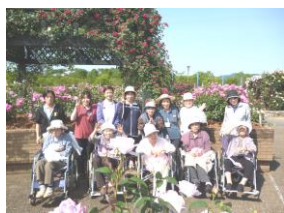
バラ園での記念撮影

本年も水俣市のバラ園に数日に分けてバラ園見物を実施いたしました。五月十一日から出水中央高校生の介護実習が行われていますが、この実習生と利用者様とのコミュニケーションの機会増も目的の一つとして実施しております。私は昨年よりも、バラ園全体のポリウムが増しているように感じました。来年もまたこの季節に訪れたいですね。