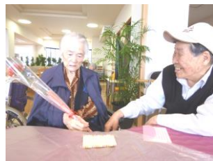
ご家族との飲談の様子

特養出水の里では、現在百三歳の方を筆頭に六十 三名の女性利用者様(五月十日現在)がいらっしやい ます。この方々を会場(A B棟食堂)にお招きしての『母の日茶話会』を、 五月十日(日)の十四時三十分より開催させていただきました。