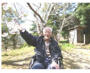
菅原神社の桜の木の下で

今年の桜見物は、天気の都合上企画していた日程での遠出は難しくなつたので、特養出水の里から徒歩圏内にある菅原神社にて、それぞれ桜見物を行いました。三月月末にて数日間実施しましたが、体調の都合上なかなか外出企画に参加することが少ない利用者様も含め、幅広い利用者様が参加することができ、結果として有意義な時間となつたのではないのでしょうか。