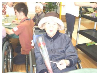
カーネーションを手にハイポーズ

当日利用滞在中であったシヨートステイ利用者様(六名も含め、テーブル に広がった厨房職員の手作りのロールケーキからちまきまでといった和洋 様々なお菓子の中から、お好きなお菓子を選んでいただき、お飲物と共に笑 顔いっぱいをつくるごのひと時を過ごしていただきました。また最後に職員 手作りの十人十色のメッセージカードをカーネー ションに添えてプレゼントさせていただきました。 このような季節の節目節目の行事は、毎年創意工 夫を重ね、よりよい行事にしていきたいと思っておりますので、ご意見等あればお気軽にお声かけくだ さい。また当日母の日に来園していただいたご家族 の皆様へ、この場を借りて御礼申し上げます。