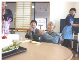
4月誕生会 出席者みんなで合唱♪

また五月誕生会では、百二歳の利用者様に対しては四月と同様にご家族を招待しての誕生会を実施しました。(四・五月とも、その他の