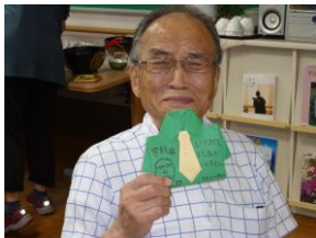
メッセージカードと共に

六月一九日父の日に、特養出水の里では『居酒屋』を開催しました。夕食時に全フロアの男性利用者様が一堂に会して、刺身や焼き鳥、山芋鉄板などの本日本製の居酒屋メニューを(ビールを片手に)それぞれ召し上がっていたり、記念撮影を行ったりしていました。