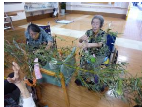
利用者様との七夕飾り作成

七夕に向けて、六月中から各フロアで色とりどりの飾りやそれぞれの願い事を書いた短冊を、その日その日で時間を作って準備を進め、七月一日には、それまで準備した短冊や七夕飾りを(笹ではなく)竹に取り付けを行いました。当日は、みんなの力で完成した七夕飾りの前で、一人一人記念撮影を行っております。