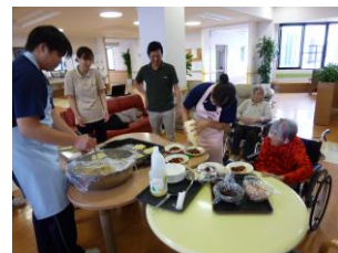
お好み焼きパーティにて