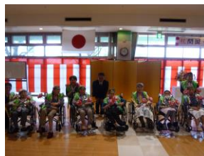
利用者様による余興披露後の記念撮影の様子