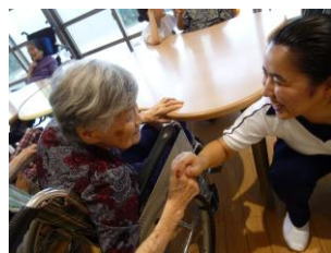
かき氷パーティの一コマ

また今回の広報誌が特別編成となり、結果として普段より多少見づらい構成となってしまうことについてお詫び申し上げます。