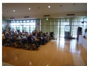
偲ぶ会当日の様子

毎年八月十三日には『偲ぶ会』を開催しています。この一年間で残念ながらご逝去された入所者の方々の思い出アルバム動画鑑賞などを行っています。その方々へのご冥福をお祈りする機会として、今後も引き続き行っていきます。