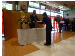
勤続 10 年表彰

その後、俣川事務局長の乾杯挨拶を経て、会食の運びとなりました。毎年工夫を重ねた献立を調理員の方々に準備していただいておりますが、今年も華やかなお膳が並んでおり、