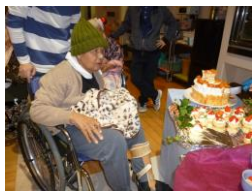
♪ケーキバイキング♪ 色とりどりの陳列です

会の終盤には職員による余興が行われ、歌やダンスなどで盛り上がり、楽しい雰囲気の中で締めくくられました。