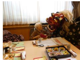
この時点ではまだまだ元気な獅子舞の乱舞!!

特養出水の里の元旦の様子は、まずA B棟食堂に一堂に会して、小幡施設長からの新年の挨拶が行われ、その後利用者の皆さん一人一人お屠蘇を順にいただいております。