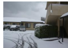
1月24日現在の出水の里玄関付近

一月二十四〜二十五日にかけての記録的な大雪により、職員の通勤や食材の納品などに遅れが生じるなどの混乱がありました。しかし、個々の職員の頑張りや地元元業者からの約四百個の弁当無償提供などもあり、利用者様の生活に支障が出る事はありませんでした。