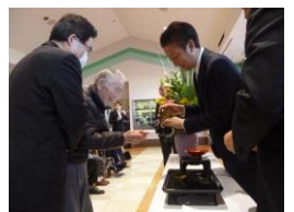
お屠蘇を皆さんで頂きました