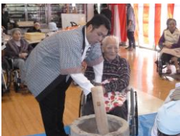
利用者様と一緒に餅つきを行いました

十二月二十八日(月)、臼・杵を用いた昔ながらの形式での餅つきを行いました。小幡施設長が返し手担当で行い、周囲の『よいしょ』の掛け声に励まされながら、職員・男性利用者様の順で餅をつきました。