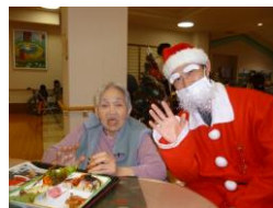
サンタさんとの記念撮影

十二月十八日(金)にクリスマス忘年会を開催しました。忘年会として一年を振り返りつつ、楽しく過ごしていただけのように、クリスマス会を兼ねて企画し、『クリスマス忘年会』として少しづつ工夫を加えながら毎年年末に開催しています。