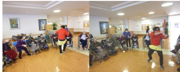
フロアに襲来した鬼と利用者との合戦!

昼食では、恵方巻にみたてた一口巻き寿司を提供させていただきました。利用者の皆さまには節分の日を満喫していただきました。