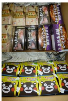
無償でいただいたお弁当の一部です。