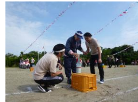
これが酒なら競技の一コマ