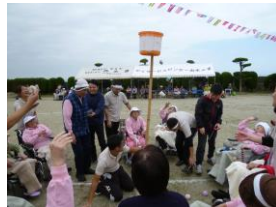
2位を獲得した 玉入れ競技