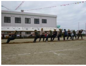
唯一の職員対抗競技 綱引き熱闘(?)の様子

中央高校生の皆さんやそして何よりご家族の皆様が(対外的には中止とした為)参加できなかったため、競技に際しての利用者様の誘導においては、その人手不足から若干滞る場面も見られていたのが、例年には無い光景であったので印象的ではありません。それでも利用者の方々からは「やっぱりこういう(運動会)がある