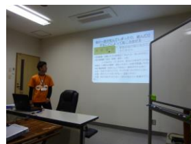
池上相談員による 認知症ケアの講義

十月二十六日に「認知症ケア」「リスクマネジメント」を題材に勉強会を開催しました。特に「認知症ケア」については県内でも数名しかいない認知症介護指導者として数々の教壇に立っている当法人事業所『デイサービスセンター出水の