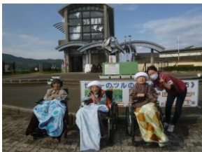
観測センターにて

したばかりの高速道路を通行し、真新しい道路に感動している様子も見られていました。