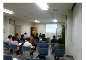
法人全事業所を対象に 30名以上の職員が 参加しました。

里さつき』の池上相談員を講師として行われ、認知症の基礎知識から基本的なケアのあり方について、グループワークを交えながら行われました。後半の部の「リスクマネジメント」も含め、計九十分間の長丁場となりましたが、参加した職員それぞれにヒントを手にした様子でした。今後もこうした機会をできる限り設けていきたいと思います。