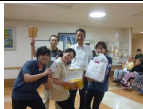
職員対抗相撲大会 表彰式の一コマ

十月四日十五夜の日には月見会を開催しました。この日は雲の切れ間から、かすかに満月を望むことができましたが、一方でフロア内においては、来園された地元子供会の方々から歌のプレゼントをいただいたり、毎年恒例の『職員対抗相撲大会』に手に汗握って応援を行った